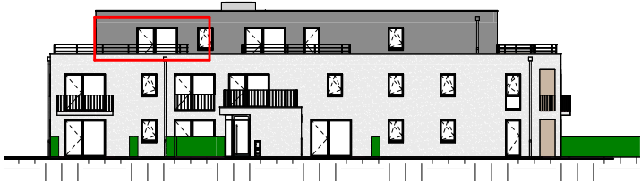
Façade Ouest - 1/400

NOTA : Ces plans de vente ont été extraits du dossier de permis de construire. Les plans techniques d'exécution seront réalisés ultérieurement et feront figurer les implantations électriques ainsi que les radiateurs. Des modifications et des ajustements techniques sont susceptibles de faire évoluer les plans. Les éléments de mobilier (meubles, appareils ménagers et plan de travail) ne sont placés qu'à titre indicatif