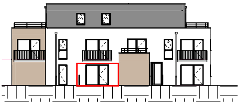
Façade Est - Échelle au 1/400ème