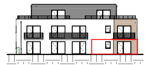
Façade Ouest - Échelle au 1/400ème