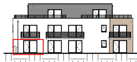
Façade Ouest- Échelle au 1/400ème

NOTA : Ces plans de vente ont été extraits du dossier de permis de construire. Les plans techniques d'exécution seront réalisés ultérieurement et feront figurer les implantations électriques ainsi que les radiateurs. Des modifications et des ajustements techniques sont susceptibles de faire évoluer les plans. Les éléments de mobilier ( meubles, appareils ménagers et plan de travail) ne sont placés qu'à titre indicatif