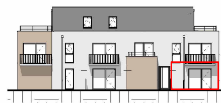
Façade Est - Échelle au 1/400ème

NOTA : Ces plans de vente ont été extraits du dossier de permis de construire. Les plans techniques d'exécution seront réalisés ultérieurement et feront figurer les implantations électriques ainsi que les radiateurs. Des modifications et des ajustements techniques sont susceptibles de faire évoluer les plans. Les éléments de mobilier (meubles, appareils ménagers et plan de travail) ne sont placés qu'à titre indicatif