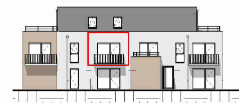
Façade Est - Échelle au 1/400ème