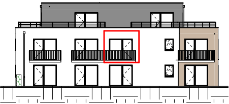
Façade Ouest - Échelle au 1/400ème

NOTA : Ces plans de vente ont été extraits du dossier de permis de construire. Les plans techniques d'exécution seront réalisés ultérieurement et feront figurer les implantations électriques ainsi que les radiateurs. Des modifications et des ajustements techniques sont susceptibles de faire évoluer les plans. Les éléments de mobilier (meubles, appareils ménagers et plan de travail) ne sont placés qu'à titre indicatif