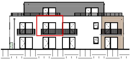
Façade Ouest - Échelle au 1/400ème

NOTA : Ces plans de vente ont été extraits du dossier de permis de construire. Les plans techniques d'exécution seront réalisés ultérieurement et feront figurer les implantations électriques ainsi que les radiateurs. Des modifications et des ajustements techniques sont susceptibles de faire évoluer les plans. Les éléments de mobilier ( meubles, appareils ménagers et plan de travail) ne sont placés qu'à titre indicatif