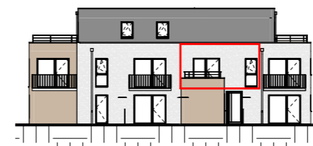
Façade Est - Échelle au 1/400ème