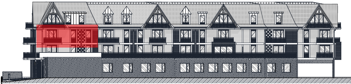
FACADE SUD - Echelle : 1/400ème